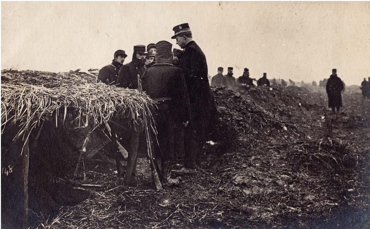
Koning Albert aan het front, 1914; zijn soldaten moesten letterlijk naar hem opkijken

vragen. Dat sterkt de Belgische jongens. Ze voelen, dat ze met hun koning één hoofd en één hart vormen in dezen strijd. 2